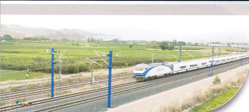
Instalación tuberías en la línea del AVE Madrid-Lleida